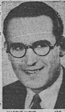
HAROLD LLOYD 1FC

PROXIMO DOMINGO! El 4º coloso del año! La gloriosa SHIRLEY TEMPLE en AHORA Y SIEMPRE con Gary Cooper y Carole Lombard