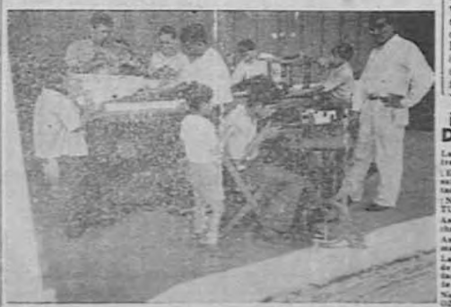
El Obsequio Fiestas de Don Juan, en cuya organización ha participado siempre en su empeño de ayudar al desvalido. Allí encuentran aliento y consuelo espiritual, los niños abandonados.