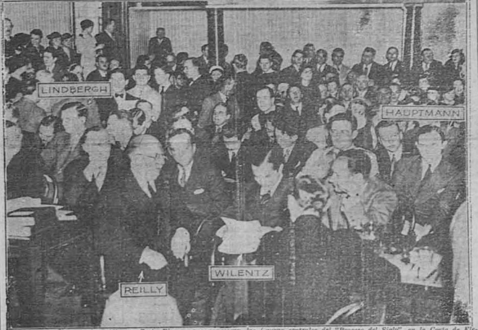
Primera fotografía que se publica en Costa Rica en que aparecen las figuras centrales del "Proceso del Siglo", en la Corte de Flemington. Lindbergh, Hauptmann, Reilly, Wilentz figuras que llenan en estos días las páginas de todos los diarios del mundo.